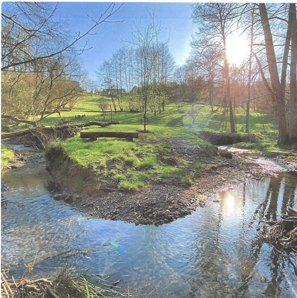
Bank beim Kloster Hassel.

Das Kloster wird von der Dharma Stiftung betrieben. In der Stiftung findet klösterliches und buddhistisches Leben eine Organisationsform, in der Ideelles und wirtschaftlich Notwendiges zusammenfließen. Sie steht in der Tradition des Theravada-Buddhismus, im Zweig der Einsiedler. Die buddhistische Erkenntnislehre und das traditionelle Ordensleben können im Kloster Hassel gut verbunden werden.